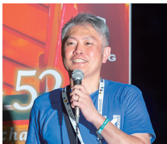
2023年7月 インターネット運用の国内会議の誘致の際の筆者(参加者:3000人)

インターネットに関する技術は、アプリなどソフトウェアの開発は日進月歩ならず秒進分歩の勢いですが、全世界で同じ機能を利用する基盤技術の普及はとても難易度の高い挑戦です。長崎からインターネット基盤のセキュリティを発信しています。