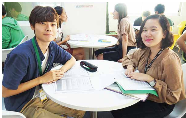
語学研修 語学学校でマンツーマンレッスンを受ける学生たち

3年次の「海外ビジネス研修」では、約3週間シンガポール、ベトナムなどの日系および現地企業などでインターンシップを行います。学んだ英語と専門知識を使って実務を行うことによって、社会の即戦力となる学びを習得し、国際人としての知見も養います。コロナ禍で過去3年間海外語学研修、ビジネス研修が実施できせんでしたが、日本貿易振興機構(JETRO)主催の貿易実務オンライン講座や、在福岡米国領事館首席領事らによる「外交官セミナー」など外部機関と連携したセミナーを開催しました。このように国際経営学科では、グローバルな視野を広げ、国際社会に通用する「即戦力」の育成に向けた「実践の場」を多く設けています。