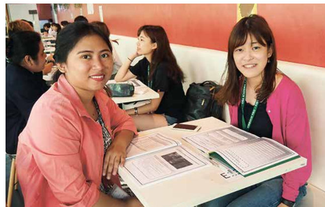
海外ビジネス研修 大学で学んだ知識を生かし現地企業で実務を行う様子