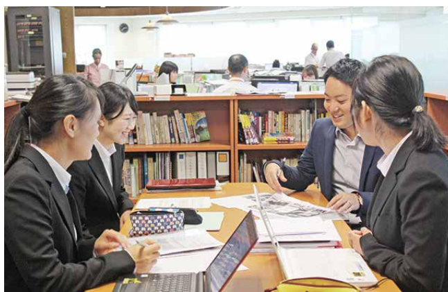
海外ビジネス研修 大学で学んだ知識を生かし現地企業で実務を行う様子