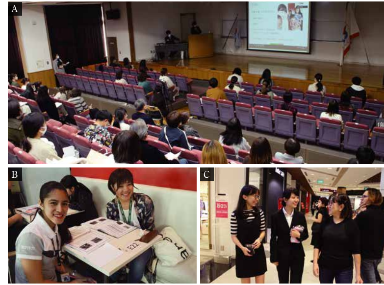
A JICAの講師を招いた「JICAデー」の様子 B 現地講師とのマンツーマン授業などで、集中的に英語が学べるフィリピン・セブ島での語学研修。 C 海外ビジネス研修では企業での就業体験を通じ、英語力のみでなくコミュニケーション力も高める学生たち。

4年間の学びを通じ、マーケティングや物流などの国際経営の幅広い知識のみでなく、グローバル人材として活躍するための教養を修得することが出来たと実感しています。それらを生かし、世界を舞台に活躍していきたいという夢を実現するため、流通業界への就職を志し、内定をいただくことが出来ました。人々の生活を根幹を支える重要な業界において、この4年間で培った知識・教養が必ず役立てられると信じています。