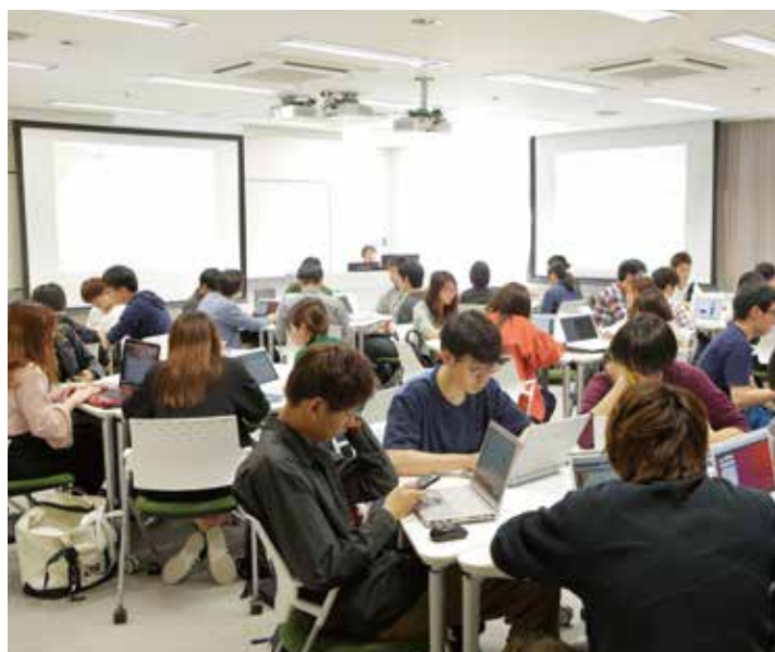
今年の春には大学院も新設した情報セキュリティ学科。2023年春には「情報セキュリティ産学共同研究センター」(仮称)の開設も計画されている。

加傾向にあります。これは本学科が成熟してきたことを意味していると思います。これまでの4年間は国内に類をみない情報セキュリティ学科だったわけですが、この成果を踏まえ、また学生数が増えることから、来年入学者からは特に計算機科学の基礎を重点にじっくり取り組めるよう、カリキュラムを強化したいと考えています。現在は、教授陣全員がよく話し合い、新しいカリキュラムがほぼ固まってきた段階です。ICT業界は日進月歩で変化していきますので、私たちも決して立ち止まることなく、変わっていかなくてはいけないと考えています。 本学科は、確固たる実践技術を身に付けられる学科です。正義感をもって、情報社会を支えていこうという考えを持つている方の入学を期待しています。