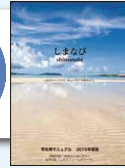
「しまなび」プログラム実施マニュアル(本学作成)