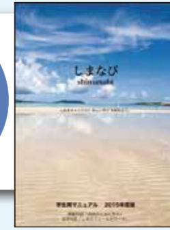
「しまなび」プログラム実施マニュアル(本学作成)