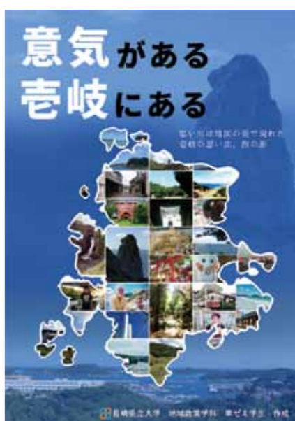
壱岐の魅力伝える観光ポスターを制作 訪問調査を生かしたデザインに

また壱岐島については、メンバー15名で「壱岐の体験・観光について調査しPRする」ことをテーマに取り組んだ。島の人々と触れ合う4泊5日のフィールドワークを通じて島の魅力を伝えるポスターを制作、観光誘客にひ