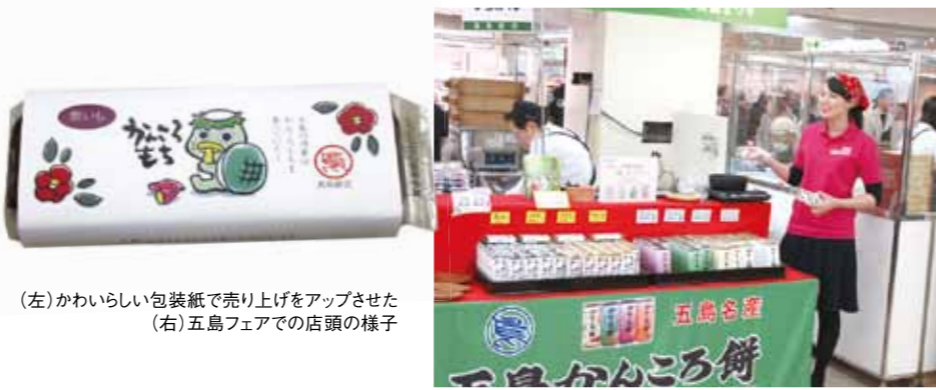
(左)かわいらしい包装紙で売り上げをアップさせた (右)五島フェアでの店頭の様子

太田学長は「継続的に取り組んでおり、学生たちは前年までの成果を参考にしより良いものをと意欲がわくのだろう。年ごとにポテンシャルが上がっている」と、手応えを感じている。