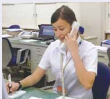
貴重な体験、大きな変化

学部学科再編後、学科の実践科目として配科しているインターンシップは、地元自治体や企業から熱い視線を集めている。